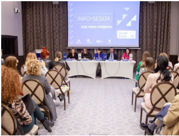
Prva info-sesija: ŽIG Ženski biznis, Hotel Hilton Podgorica, mart 2024. godine