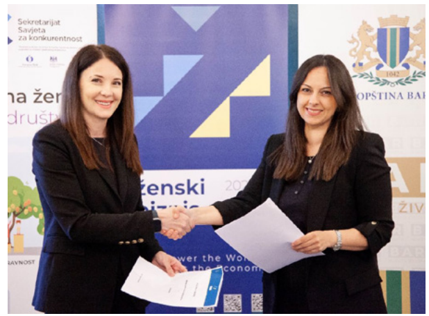
Sporazum o saradnji potpisan sa Opštinom Bar, jun 2024. godine, maj 2024. godine