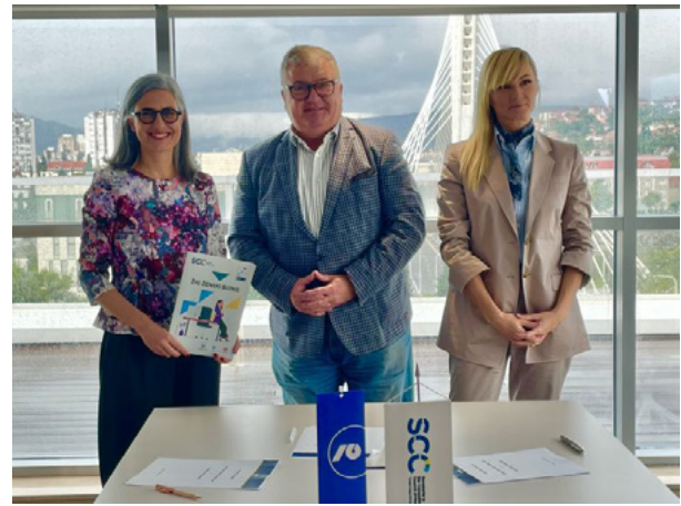
Sporazum o saradnji potpisan sa NLB Bankom, koja je jedan od pionira na crnogorskom tržištu kada je u pitanju finansijska podrška ženskom preduzetništvu, oktobar 2024. godine