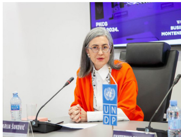
Pres konferencija: TWBM, oktobar 2024. godine