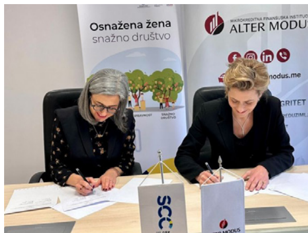
Sporazum o saradnji potpisan sa mikrokreditnom institucijom Alter Modus, mart 2024. godine

Kao što je prethodno navedeno, javno dostupan online registar sadrži podatke o privrednim društvima nosiocima ŽIG-a Ženski biznis, kako bi olakšao donosiocima odluka postupak odlučivanja i selekcije za neki od programa podsticaja i podrške koji sprovode. Registar sadrži kompletne podatke o privrednom društvu, nosiocu žiga kao što su naziv, PIB, PDV broj, adresa, kontakt, e-mail, web, djelatnost, klasifikacija, godina osnivanja, vlasnica/e, izvršna direktorica, itd. Registar sadrži i podatke o datumu izdavanja žiga, kao i datum posljednje promjene i dostupan je, pored sajta Sekretarijata Savjeta za konkurentnost, i na portalu BI Consulting koji koriste većina poslovnih banaka i finansijskih institucija u Crnoj Gori.