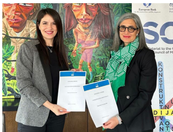
Sporazum o saradnji potpisan sa faktoring kompanijom Financial Solutions, mart 2024. godine