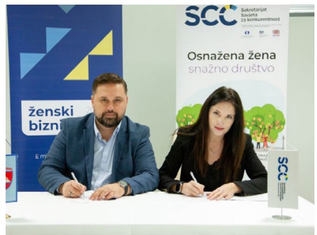
Sporazum o saradnji potpisan sa Opštinom Bijelo Polje, oktobar 2024. godine