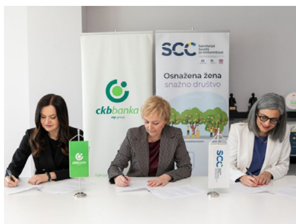
Sporazum o saradnji potpisan sa CKB bankom, mart 2024. godine