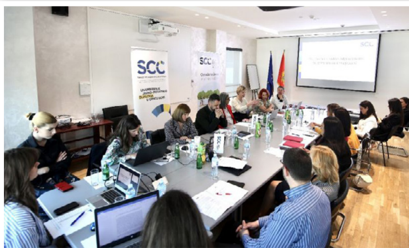
Sastanak „Dijalog o rodno odgovornom budžetiranju (ROB)“, koji ima za cilj redovnu razmjenu informacija o preduzetim i planiranim aktivnostima ključnih partnera, april 2024. godine

U okviru organizovanih radionica, znanje i informacije su prenijeti putem interaktivnih vježbi. Ciljna grupa ovih obuka su zaposleni/e u odjeljenjima za kreiranje budžeta pri ministarstvima i kontakt osobe za rodnu ravnopravnost. Sva ministarstva su bila pozvana da kandiduju po dvije osobe koje pripadaju navedenim ciljnim grupama.