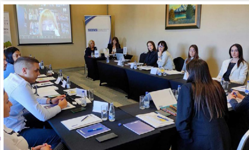
Četvorodnevna obuka trenera/ica za rodno odgovorno budžetiranje (ROB), oktobar 2023. godine