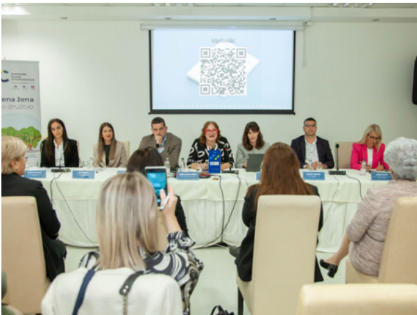
Info-sesija: ŽIG Ženski biznis, Bijelo Polje, oktobar 2024. godine