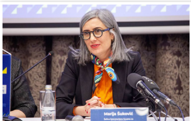
Pres konferencija: ŽIG Ženski biznis, Podgorica, januar 2024. godine