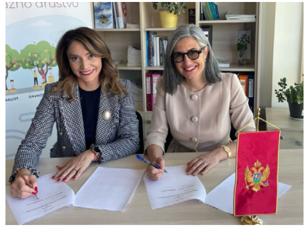
Sporazum o saradnji potpisan sa Ministarstvom finansija Crne Gore - Direktorat za upravljanje javnim investicijama i politiku javnih nabavki, jun 2024. godine