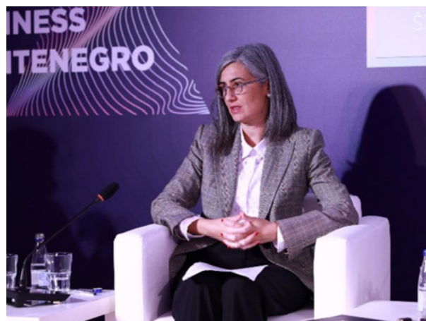
Panel diskusija „Žene u biznisu - gdje smo, šta nedostaje i kako možemo napredovati?“, u okviru inicijative TOP Women Business Montenegro, oktobar 2023. godine