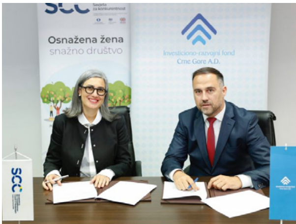
Sporazum o saradnji potpisan sa Investiciono-razvojnim fondom Crne Gore AD, april 2024. godine