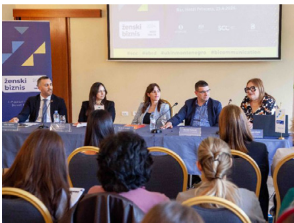
Info-sesija: ŽIG Ženski biznis, Bar, maj 2024. godine