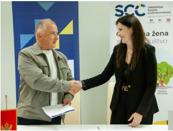
Sporazum o saradnji potpisan sa Opštinom Petnjica, oktobar 2024. godine